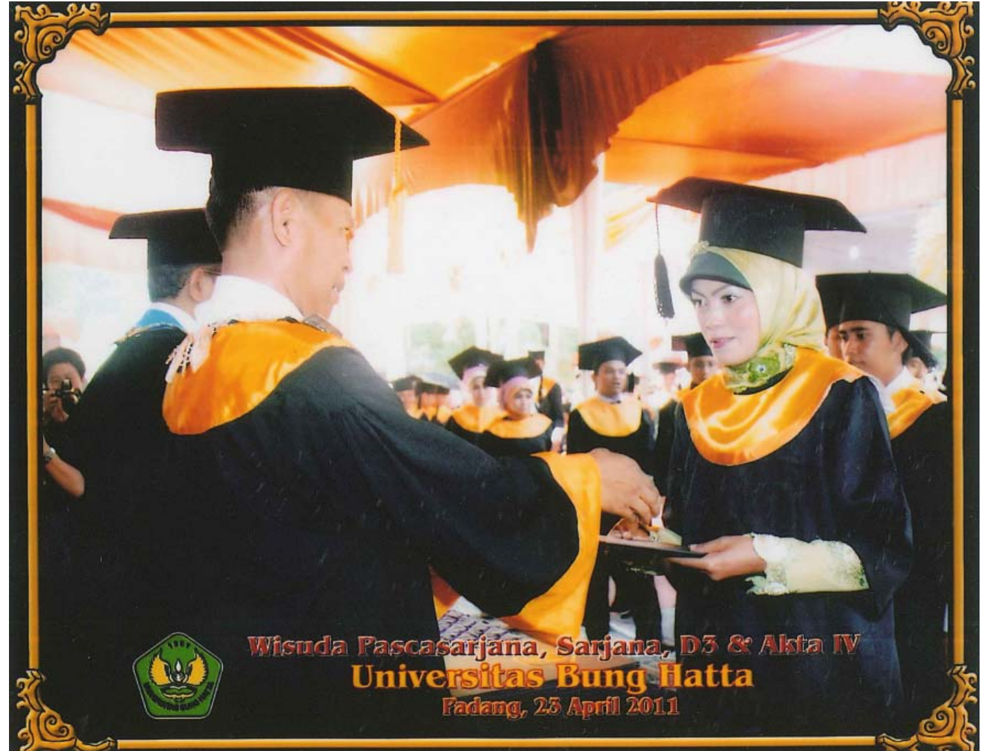
Wisuda Pascasarjana, Sarjana, D3 & Akta IV Universitas Bung Hatta Padang, 23 April 2011