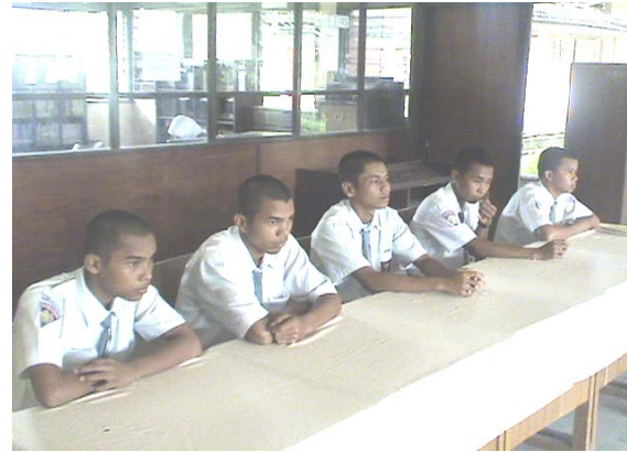
The Selected Team was choosing the student as scholarship grantee from SMK I Pariaman