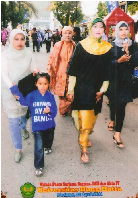
Wisuda Pascasarjana, Sarjana, DIII dan Akta IV Universitas Bung Hatta Padang, 23 April 2011