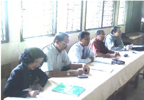
The student of SMK I Pariaman was participating in the scholarship grantee selecting from rotary club