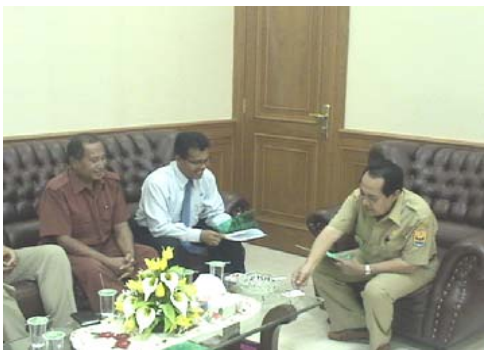
The meeting with the major of PARIAMAN STATE